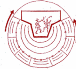
• Elisabethaans theater

De vorm van Elisabethaans theater is rechtstreeks van de Grieken overgenomen. De grens tussen de acteurs en spelers is er bijna niet. Deze vorm vond je terug in de tijd waar rondtrekkende spelers in de Engelse herbergen hun verhalen en toneelstukken kwamen opvoeren.