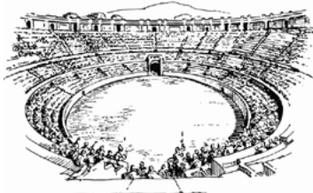
• Arena theater

De Grieken waren de eerste mensen die een vorm van theater bouwde dit noemde men een arenatheater . Deze cirkelvormige bouwwerken zorgden ervoor dat er veel mensen in een keer naar het schouwspel konden kijken.