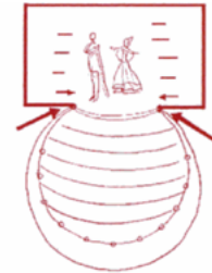
• Theater a l'italienne

Théâtre à l'italienne ontstond in Italië. Het heeft wat weg van het theater uit de tijd van de Romeinen. Alleen is het podium breder dan de ruimte voor de toeschouwers. Hierdoor ontstond er voor het eerst een coulisse. Vanuit de coulissen konden de acteurs opkomen en de scène ook weer verlaten. Het decor wordt vanaf nu veel belangrijker. Ze begonnen met grote schilderijen die suggereerden dat het schouwspel zich ergens anders af zou spelen dan het theater zelf.